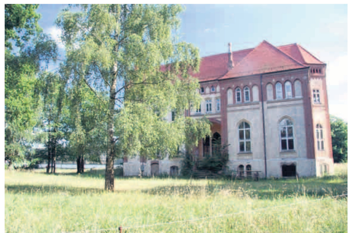
Das Herrenhaus in Walow ist mit Backsteindekor verziert. Nur das Dach wurde bisher saniert