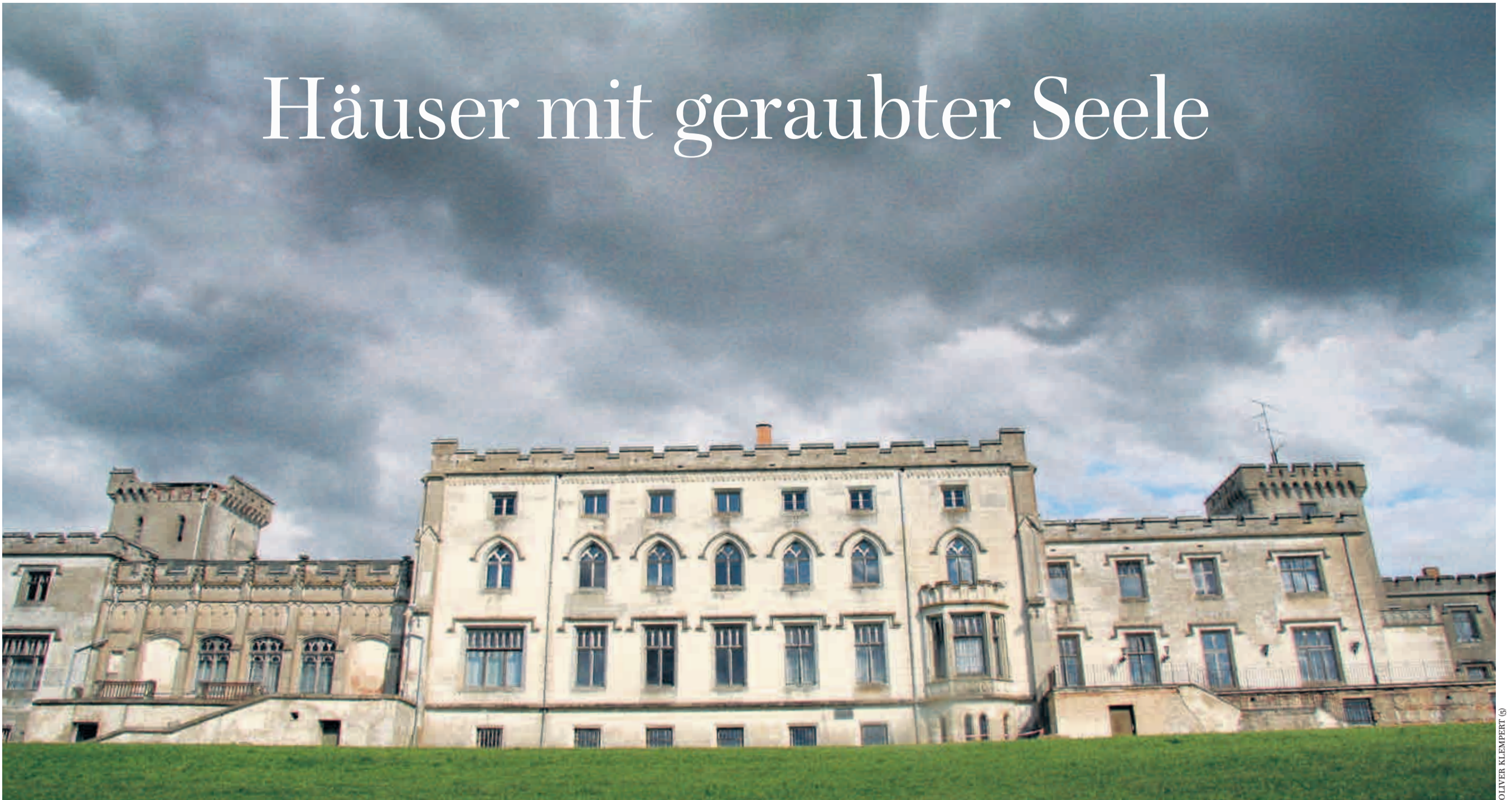
Das Herrenhaus in Varchentin westlich von Neubrandenburg zählt zu den imposantesten Immobilien in Mecklenburg-Vorpommern. Mit seinen Zinnen und Türmen strahlt es Burg-Charakter aus. Seit Jahren steht es leer

Teil 1 der Serie „Gutshäuser in Ostdeutschland“: In Mecklenburg-Vorpommern gibt es auf wenig Raum so viele Schlösser und Herrenhäuser wie nirgendwo sonst in Europa. Manche der Immobilien sind saniert und werden genutzt, die meisten stehen jedoch leer. Fehlende Konzepte und hohe Kosten schrecken Investoren ab