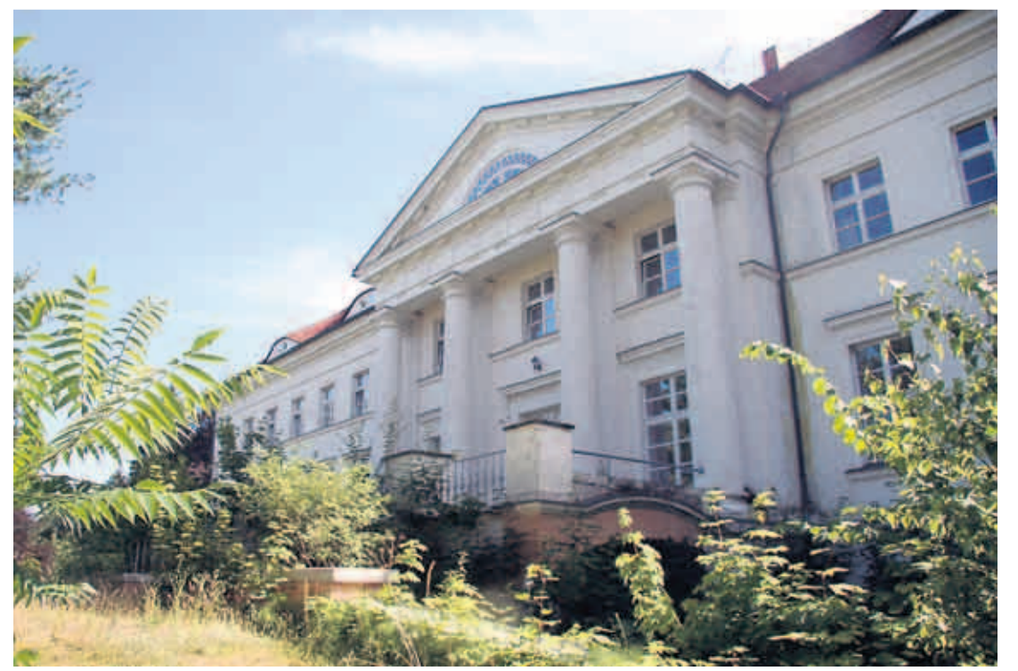
Das Gutshaus in Retzow mit majestätischem Portal wird von Pflanzen umwuchert