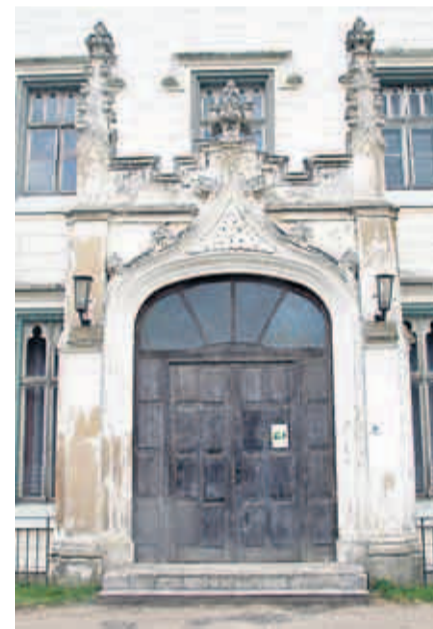
Verzierungen aus früherer Zeit sind über dem Eingangsportale des Herrenhauses in dem Dorf Varchentin bis heute erhalten (links). An vielen Stellen ist der Putz abgeblättert oder ausgebleicht (rechts)